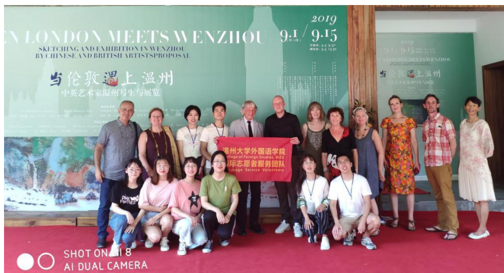
图为：翻译专业同学参加“伦敦遇上温州”中英艺术家写生交流翻译志愿者活动