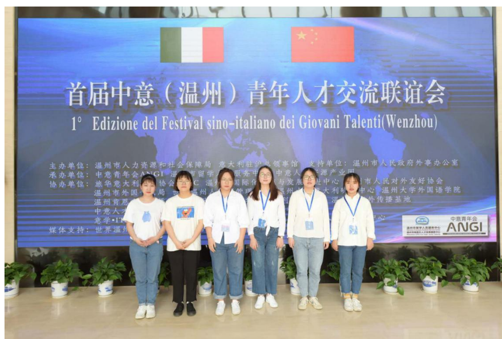
图为：翻译专业同学参加中意青年人才交流联谊会翻译志愿者活动

温州大学翻译专业秉承“厚知识、强能力、高素质”的人才培养理念，坚持“翻译+”的培养模式。语言唇指翻转，摆渡中西文化。温州大学欢迎您！翻译专业欢迎您！