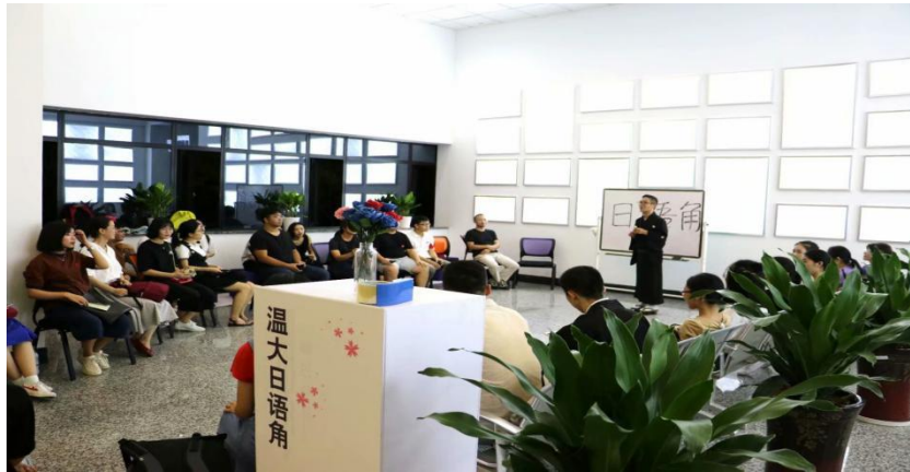
学生参加第二课堂日语角活动